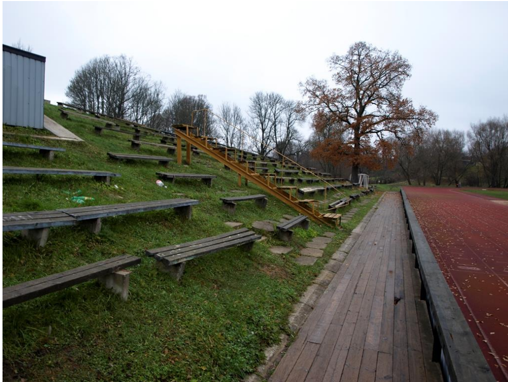
Aizputes novada stadiona tribīnes pirms rekonstrukcijas